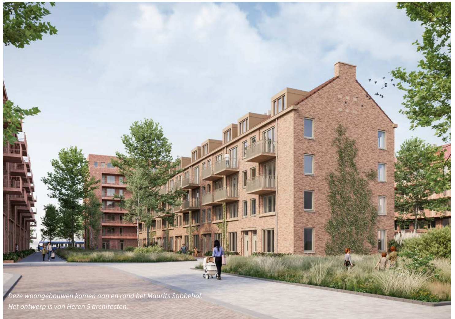
Deze woongebouwen komen aan en rond het Maurits Sabbehof. Het ontwerp is van Heren 5 architecten.

Stuur dan een mailtje naar maysa@vooruitproject.nl of loop langs bij het Rochdale Buurtpunt, Lodewijk van Deyssselstraat 41.