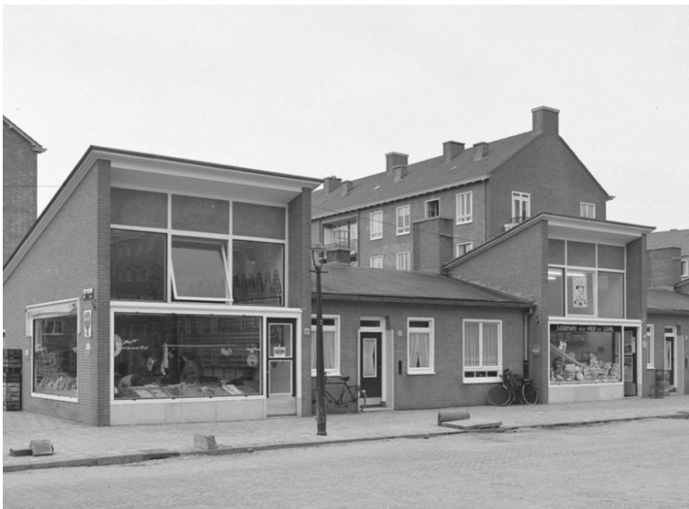
Lodewijk van Deyselstraat 49-59, foto uit november 1954

De Lodewijk van Deyselstraat heeft een heel eigen en bijzonder karakter. De winkeltjes en huizen zijn in blokken gebouwd tussen 1952-1954 door woningbouwvereniging 'Patrimonium'. De winkels met glazen etalages liggen op het noorden, waardoor het hier vaak koeler is. De tuinen van de woningen liggen op het zuiden, dus daar schijnt vaker de zon en is het warmer. De kleine winkels voegen iets toe voor de buurt en daar zijn ze ook voor bedoeld.