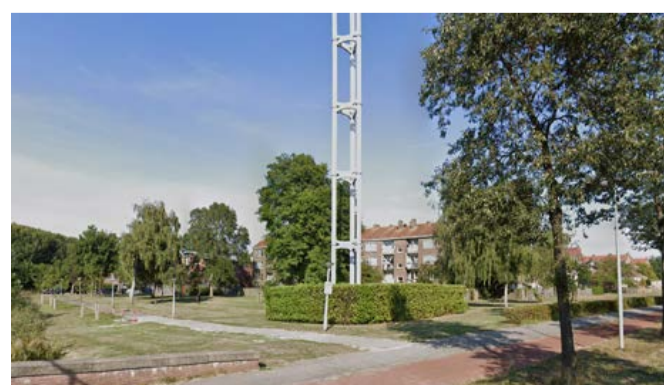
Op deze plek komt het nieuwe schoolgebouw

De nieuwe school wordt een modern gebouw. Het wordt maximaal 13 meter hoog en krijgt 2 verdiepingen. In het