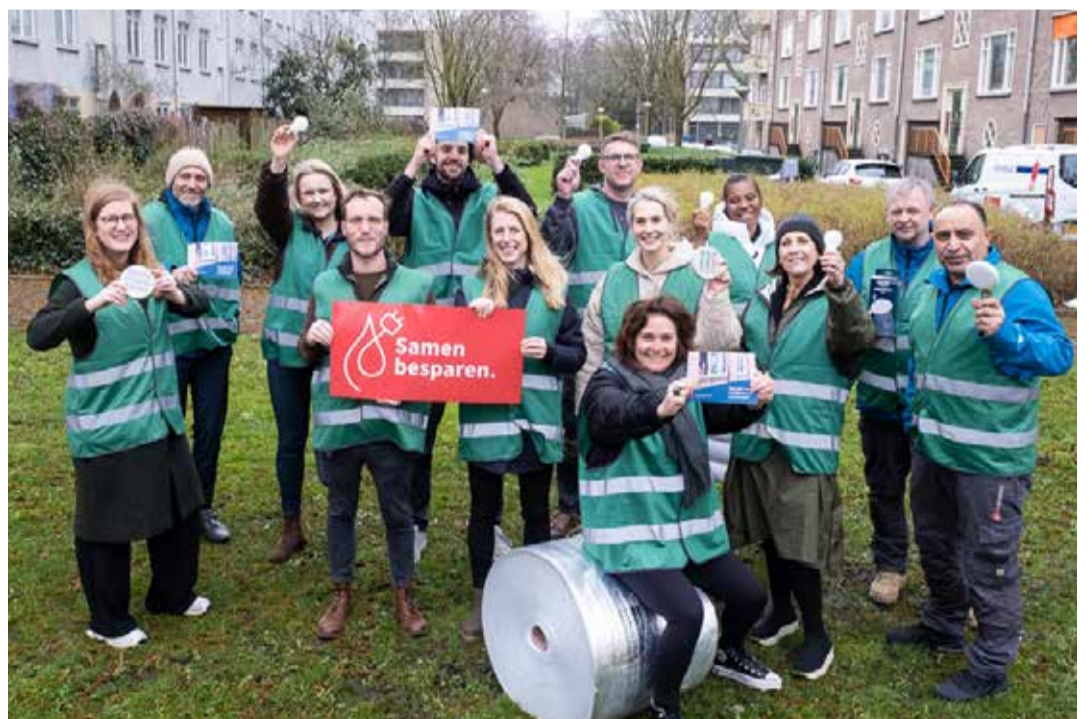
Energieteam Rochdale.

Kunt u niet langskomen? Dan kunt u ook bellen of mailen naar het Energieteam. Telefoon: 06 2600 6549. E-mail: energiecoach@buurtteamamsterdamnieuwwest.nl . U kunt het Energieteam bereiken van maandag tot en met vrijdag, van 09.00 tot 17.00 uur.